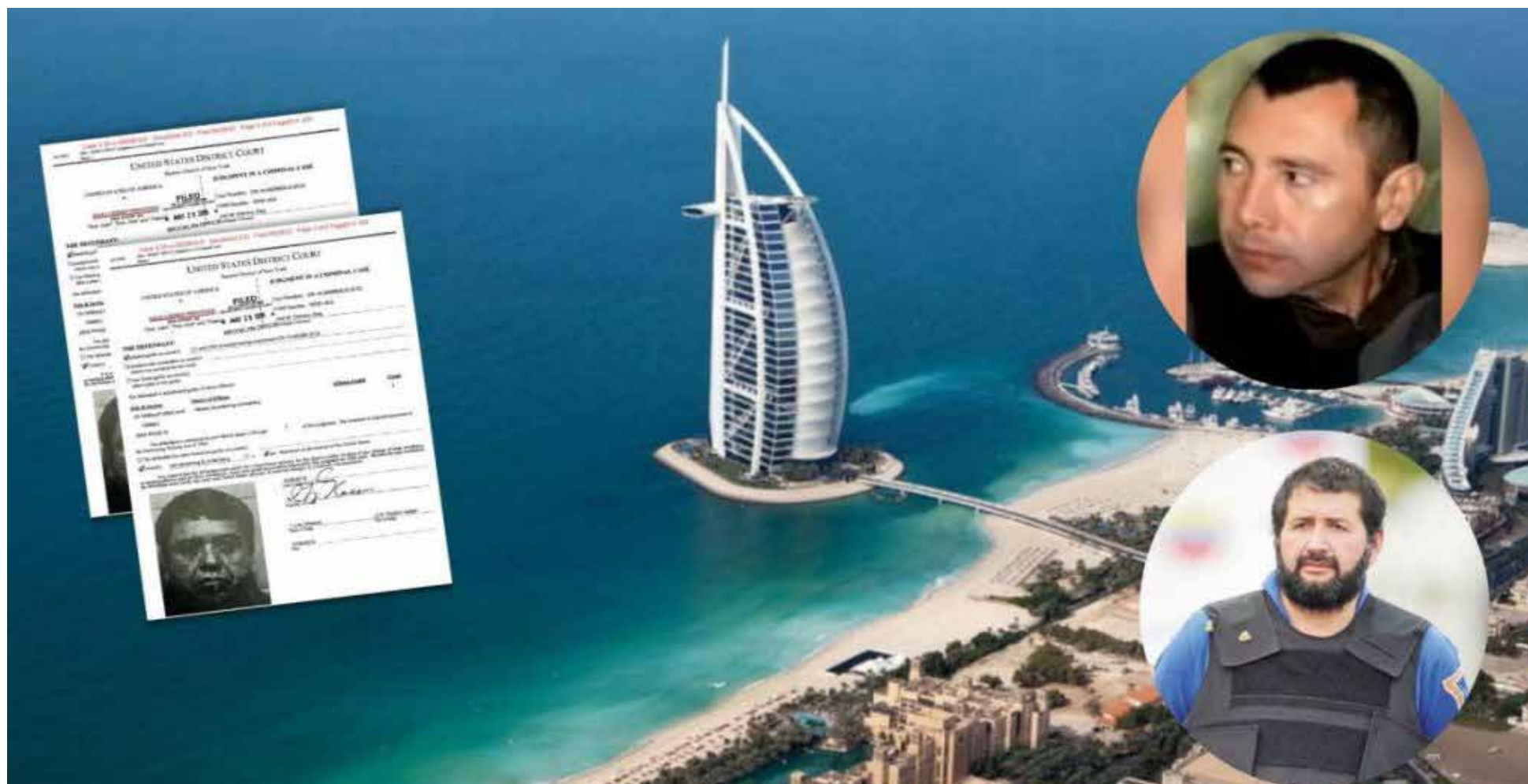
La boda, el millonario salvadoreño y los capos colombianos detrás de la 'junta directiva de la mafia' que se esconde en Dubái

ya la importancia que las autoridades colombianas están dando a esta conexión.