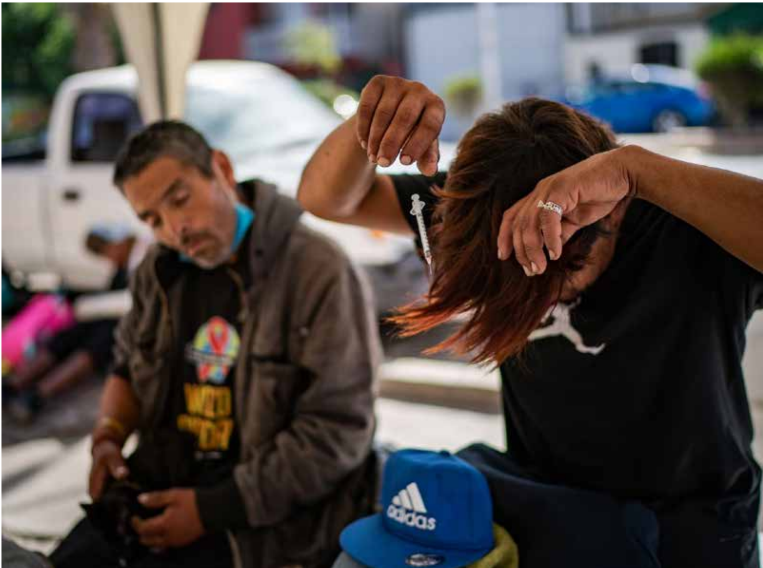
El fentanilo convierte a los consumidores en «zombis»

Según el Instituto de Medicina Legal, en Colombia se han registrado dos muertes relacionadas con el Fentanilo.