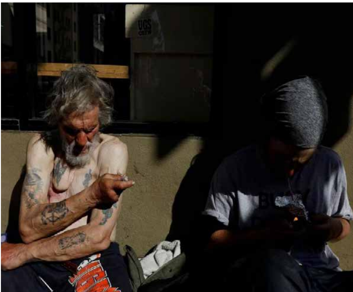
Cuando se detecta fentanilo en los casos de sobredosis, normalmente es porque está asociado a heroína en compuestos elaborados

El fentanilo no tiene olor ni sabor. La única forma para determinar si una sustancia contiene fentanilo es analizándola. Y debido a que muchas interacciones con el fentanilo son accidentales, la mayoría de las personas no están preparadas para una posible sobredosis.