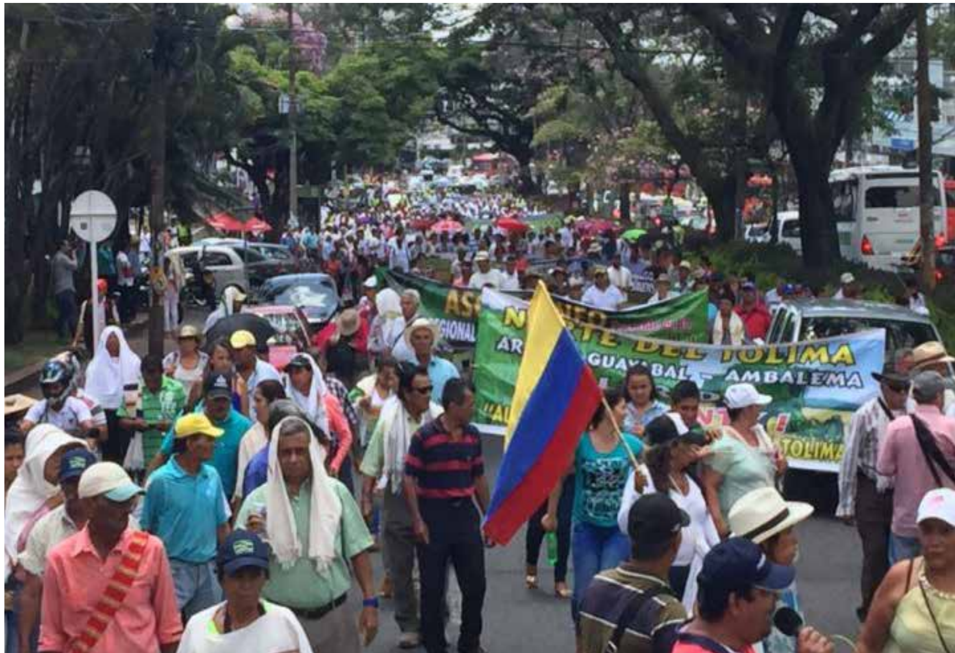
Protesta de arroceros