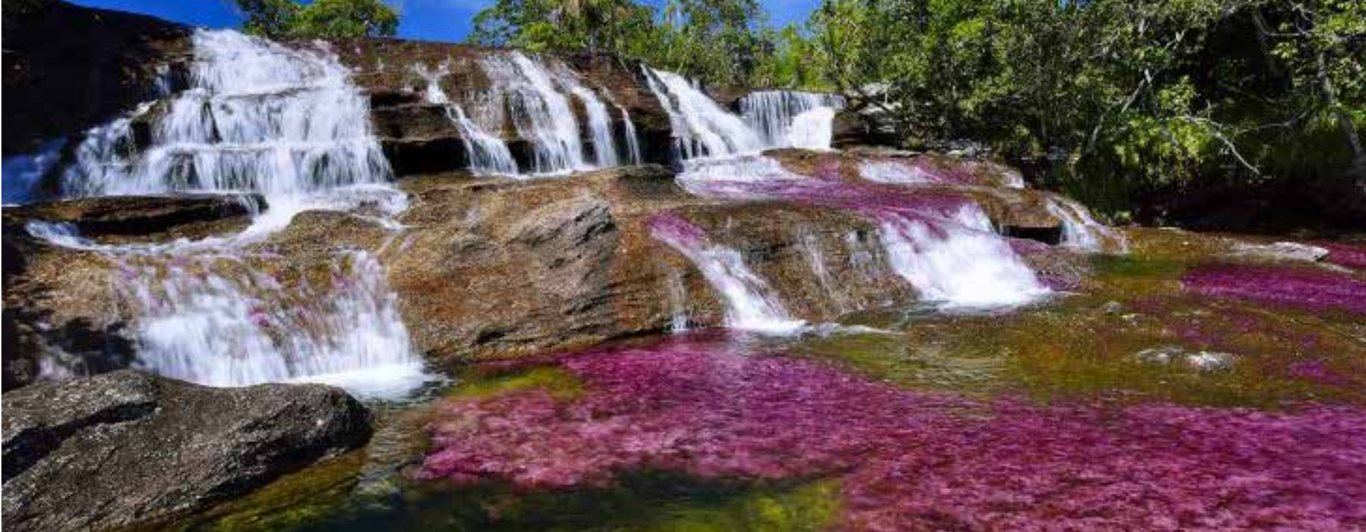
National Geographic, calificó al Caño Cristales como el río que escapó del paraíso.