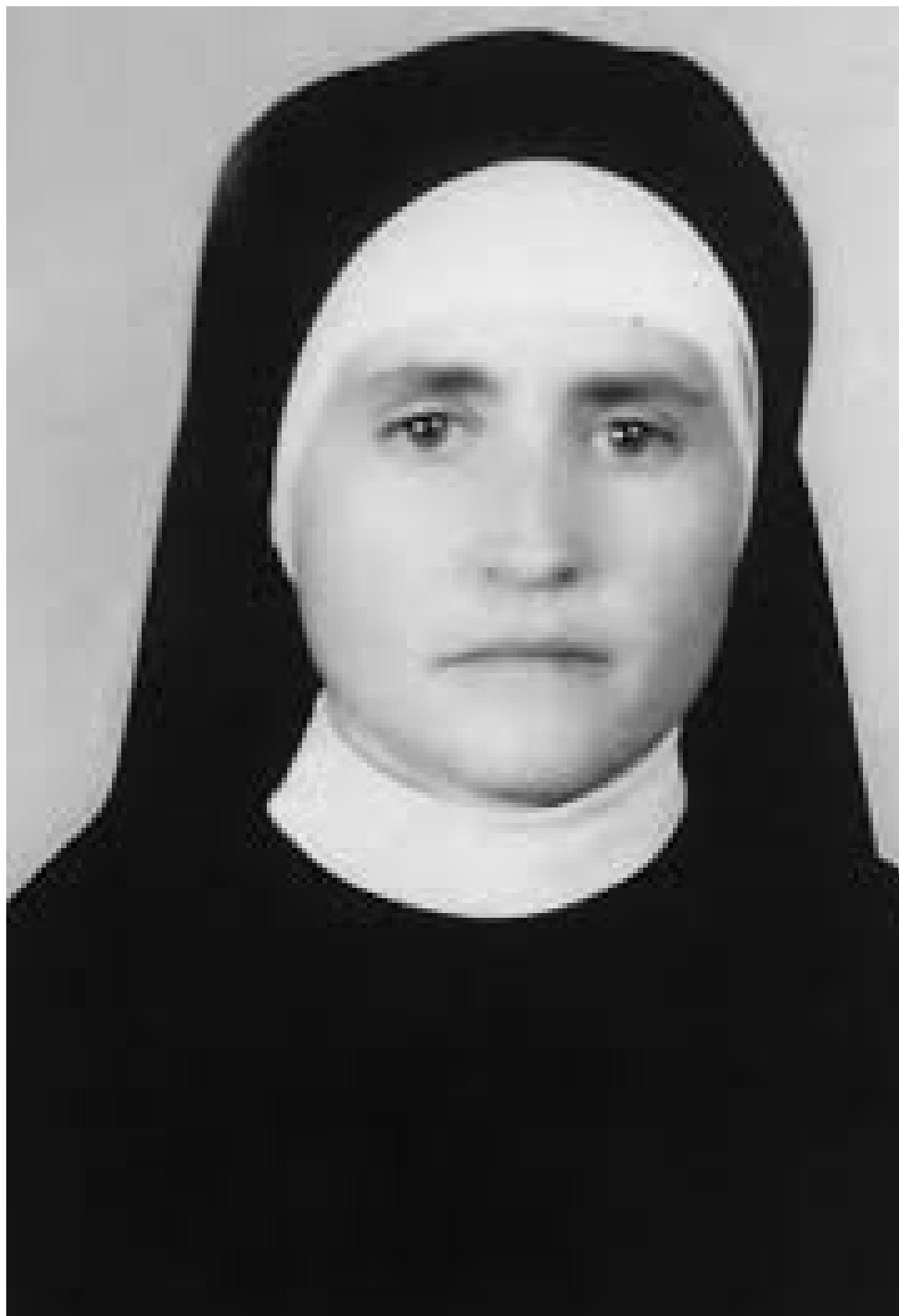
María Inés Arango Velásquez, Beata