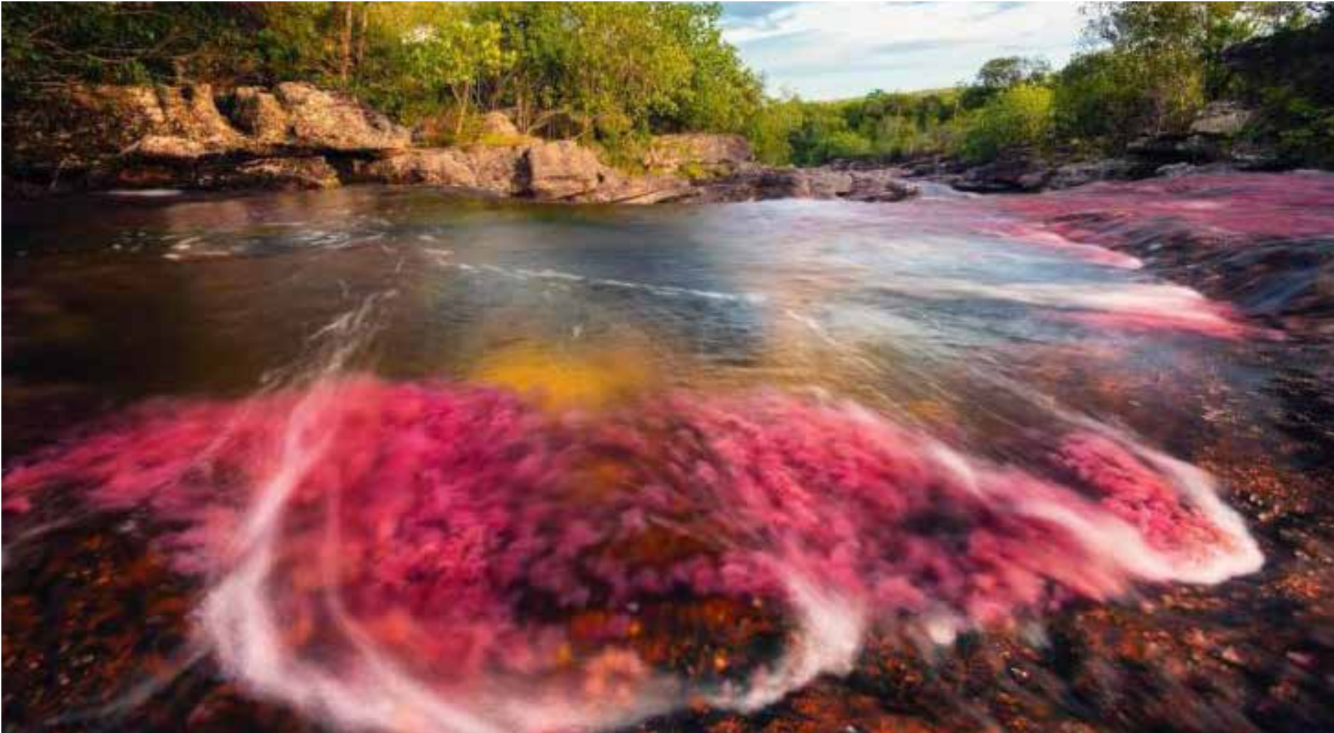
Los colores amarillo, azul, verde, rojo y negro que puedes observar a través de las aguas cristalinas del río son producto de una planta acuática endémica, la Macarenia clavigera, que al contacto con los rayos del sol pinta de tonos hermosos a Caño Cristales.